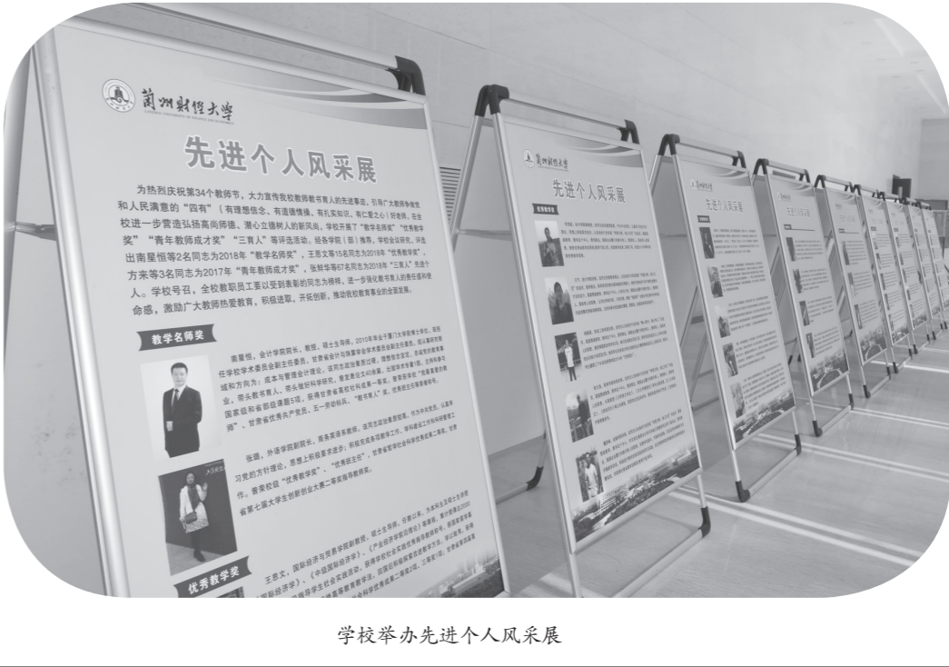
学校举办先进个人风采展