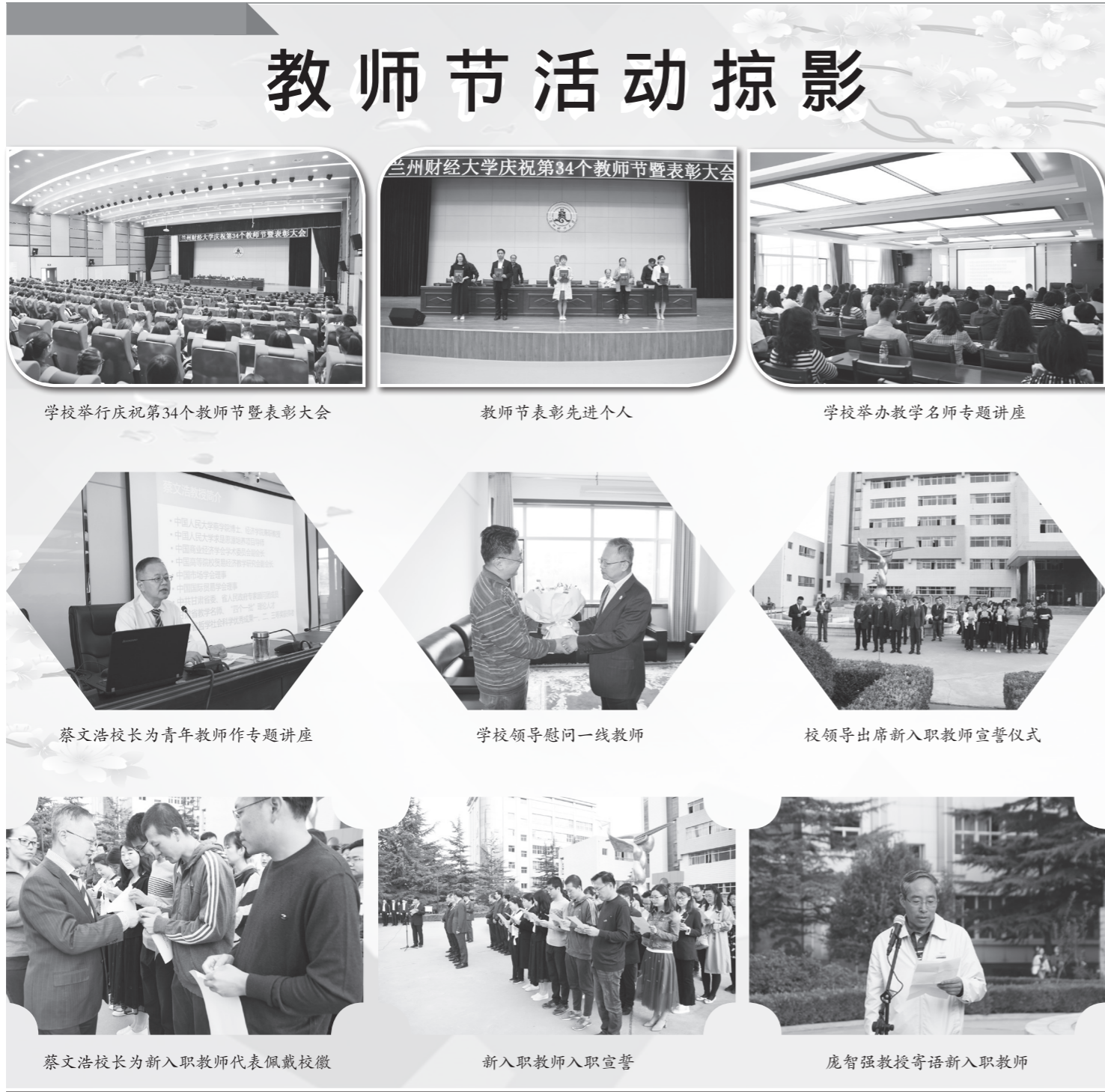
学校举行庆祝第34个教师节暨表彰大会