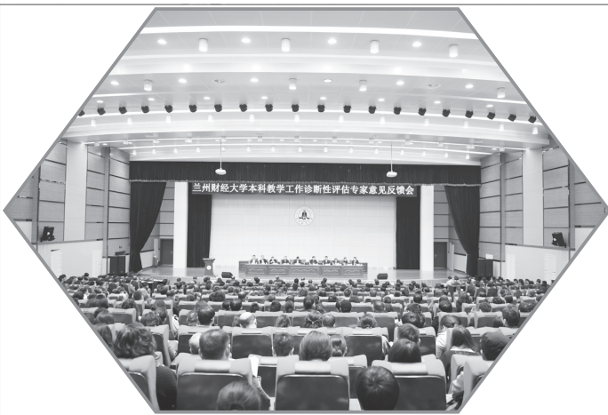
本科教学工作诊断性评估专家意见反馈会