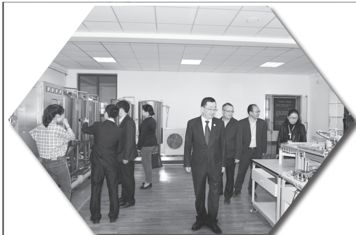
参观创新创业学院