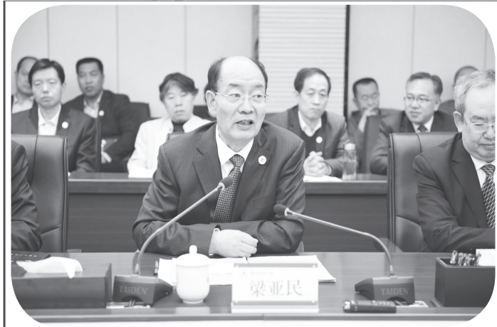
校党委书记梁亚民致辞