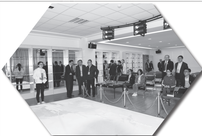
参观经济管理实验教学中心