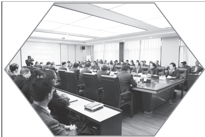
本科教学工作诊断性评估专家见面会