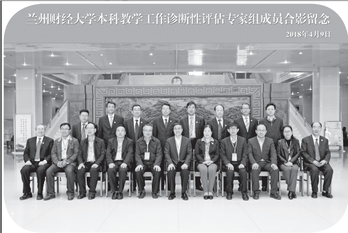
兰州财经大学本科教学工作诊断性评估专家组成员合影留念 2018年4月9日